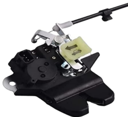
TRUNK LATCH ACTUATOR