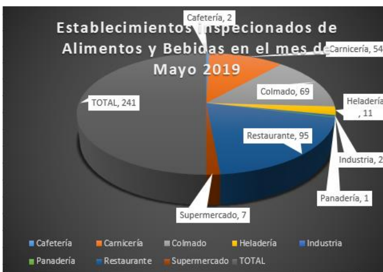
Tabla y Gráfico – por establecimientos inspeccionados grupo A&B