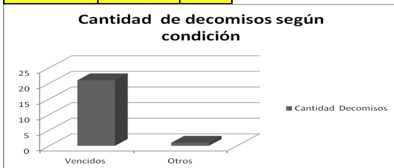
Tablas y Gráficos – Condiciones del producto