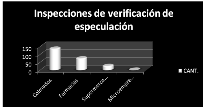
Tabla y Gráfico – por establecimientos inspeccionados grupo de especulación