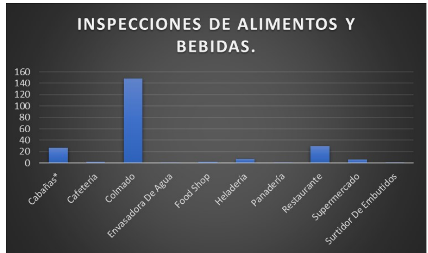
Tabla y Gráfico – por establecimientos inspeccionados grupo A&

NOTA: EN EL SIGUIENTE CUADRO INCLUIAMOS A LAS CABAÑAS, LAS CUALES SON PERTENECIENTES AL RUBRO DE SERVICIOS TURÍSTICOS, YA QUE A LAS QUE TENÍAN COCINA SE LE REALIZÓ VERIFICACIÓN.