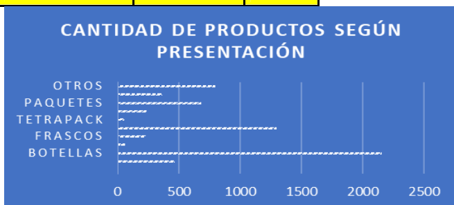
Tabla y Gráfico – Presentación de los productos decomisados