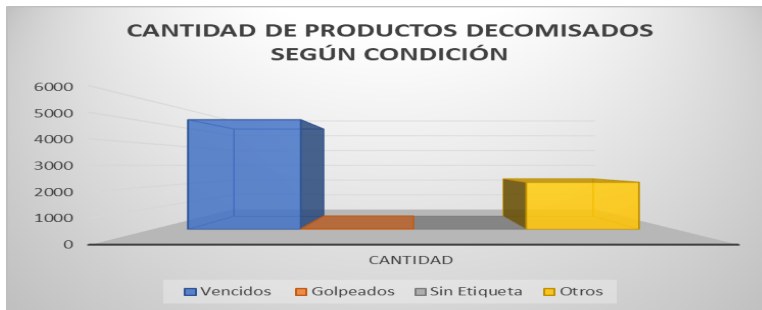
Tablas y Gráficos – Condiciones del producto