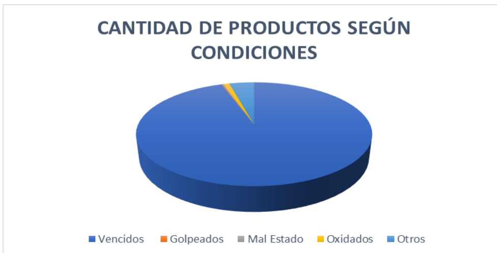
Tablas y Gráficos – Condiciones del producto