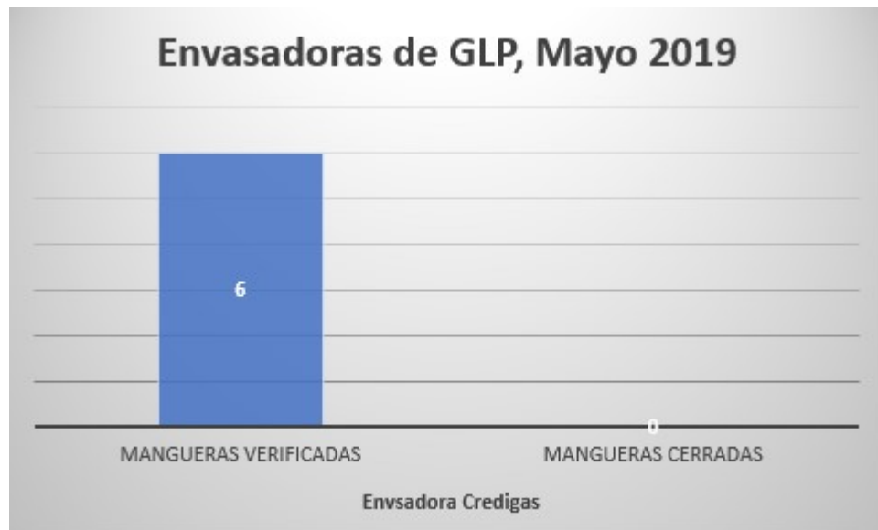
Tabla y Gráfico – GLP