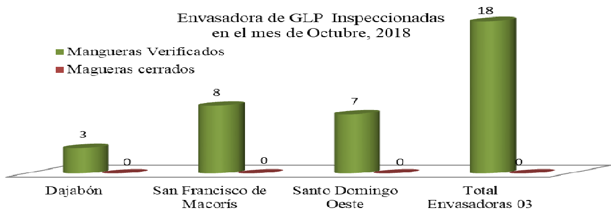
Gráfica 4 - GLP