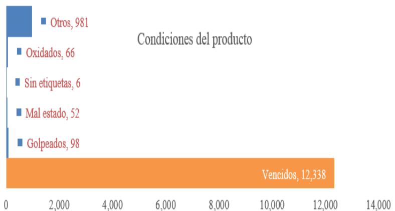
Gráfico: Condiciones del producto

Av. Charles Sumner No. 33, Los Prados, Santo Domingo, D.N., República Dominicana Para denuncias: 809-567-8555 • Desde el interior sin cargos: 1-809-200-8555 www.proconsumidor.gob.do