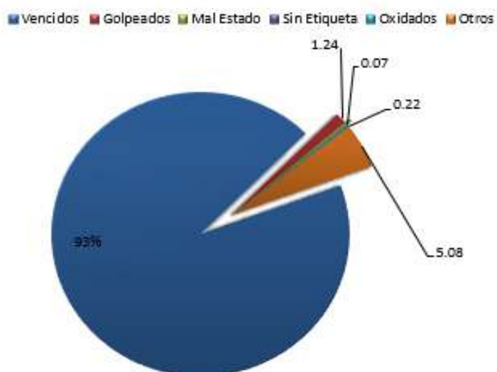
Gráfico: Condiciones del Productos